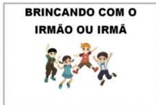
Figura 27 Carta 7